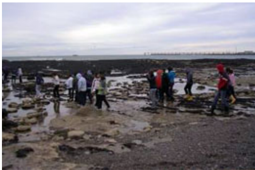
Recolección de algas

La formación de valores, el trabajo en equipo, el respeto por las ciencias y los avances tecnológicos son aspectos que hacen a la oferta de los Clubes de Ciencia.