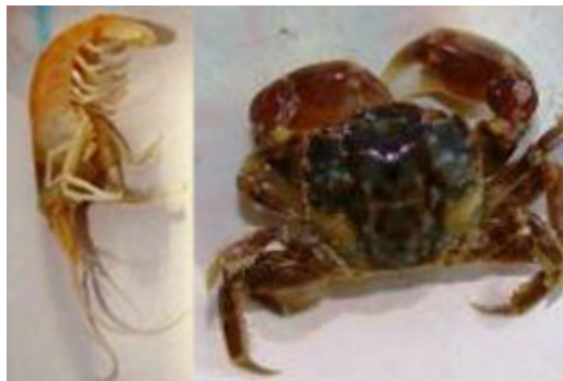
Muestreo de la fauna de Playa Santa Isabel

Diversas actividades de campo son acompañadas por los profesores asesores desde el ámbito escolar.