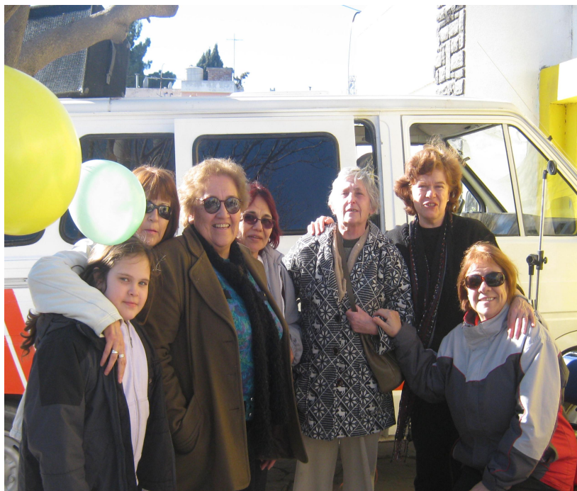
Hogar de niños