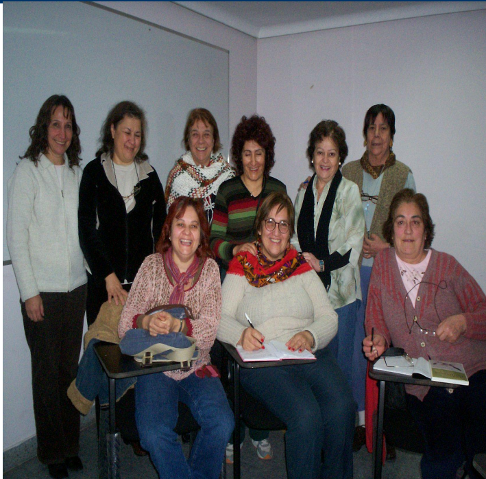
Inicio de 2.008