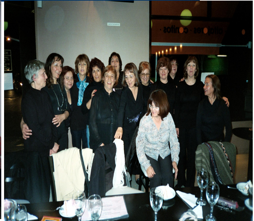
Fines de 2.009